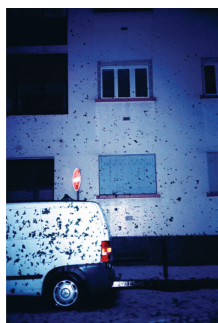
© Gaël Bonnefon - L'enlèvement, 2009

De la nature devenue précieuse, des lambeaux épars, recueillis comme un trésor. De ce monde découpé comme un puzzle, la vie reprend dans l'objectif qui recompose, rassemble. Illusion d'optique, vanité de créateur ? Non, juste la tentation d'un retour à l'enfance du monde, au rêve primitif du premier jour où chaque élément reprend sa place, abolissant le chaos. Étrangement, tout vit : l'oiseau s'abreuve dans des eaux calmes et pures, l'herbe crisse sous les sabots, l'aube point ou bien la lumière du jour s'éteint. Là tout n'est qu'ordre et beauté... Et l'oeil de l'animal nous fascine, nous questionne et nous laisse sans réponse au bord du temps. Qui de nous deux regarde l'autre ?