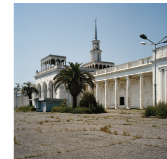
Gare ferroviaire de Soukhoumi (Abkhazie), 2008

Voilà dix ans que je parcours les ex-Républiques soviétiques. Russie, Asie Centrale, Caucase, Europe de l'Est, quelles que soient les thématiques que j'ai pu aborder dans ces pays, mon travail photographique a une portée documentaire mais plus subjectivement parle de la perte et de l'abandon. Depuis la fin de l'Union Soviétique, peu de ces anciennes républiques sont parvenues à trouver un modèle social, économique et politique stable. Un bien lourd héritage pèse sur leurs épaules, source de conflits, de catastrophes écologiques et de dépendance vis-à-vis de la Russie. Mes images parlent de cela à travers la simple rencontre de réfugiés oubliés ou de pêcheurs qui ne pêchent plus. La nostalgie qu'elles expriment parfois à travers des lieux abandonnés ou d'un autre temps est sans doute celle dont les gens là-bas sont empreints face aux difficultés qu'ils vivent au quotidien. De fait la problématique de ce travail s'attache davantage à montrer « ces mondes en voie de disparition » plutôt que ce qui en renaitra.