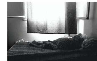
© Halida Boughriet : Mémoire dans l'oubli , 2011 (tirage numérique 150x100)

La série « Mémoire dans l'Oubli » est une galerie de portraits de femmes dont l'histoire commune (la guerre d'Algérie) s'appuie sur un protocole formel précis. Chaque photographie révèle l'image d'une veuve algérienne, le visage marqué par les ans, le corps fatigué par le poids de l'histoire, allongée sur un sofa, une fenêtre ouverte surplombe la scène et laisse s'abattre une lumière irradiant l'intérieur.