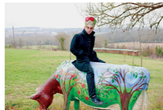
Another Country

Une œuvre personnelle et documentaire sur la réalité et les fantasmes des Britanniques expatriés en France.